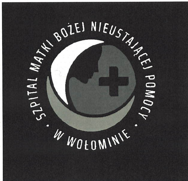
Wersja logo na ciemnym tle