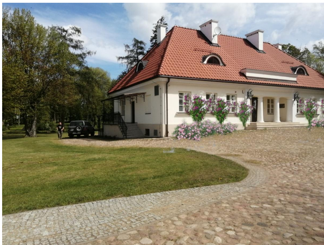
Fot.3 Wizualizacja frontu dworu.