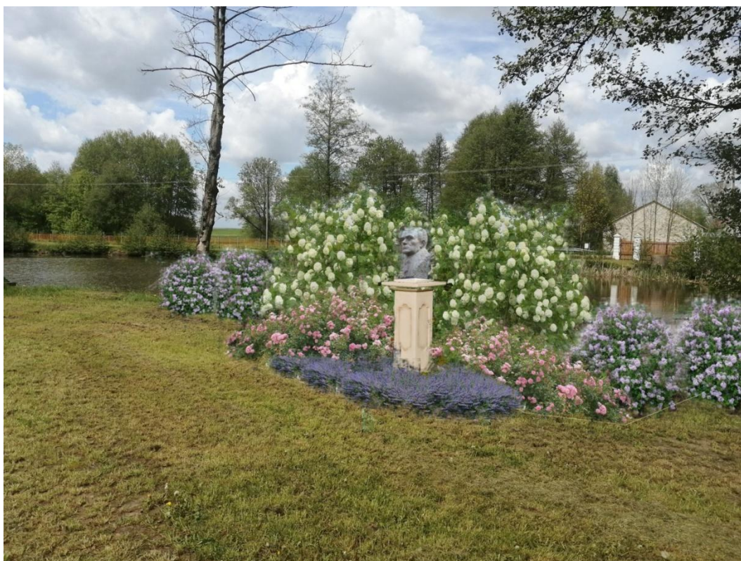
Fot.5 Wizualizacja otoczenia przy pomniku Stefana Żeromskiego