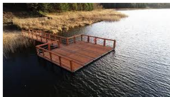
Fot.7 Przykładowe zdjęcie

Pierwszy pomost składa się z 3 paneli o wymiarach 1,5 x 1,5 m