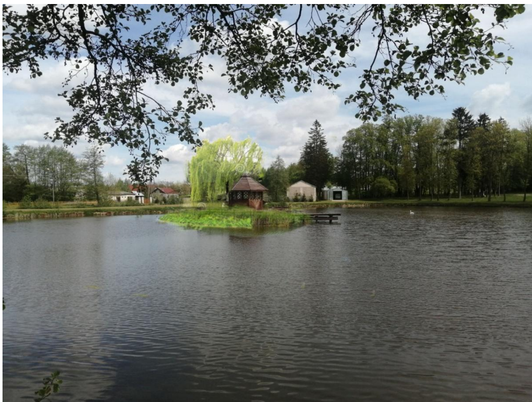
Fot.4 Wizualizacja wyspy