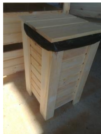
Fot.6 Przykładowe zdjęcie

Materiał: Elementy stalowe + drewno iglaste Wysokość: 82 cm Szerokość: 38 cm Pojemność: 70 l