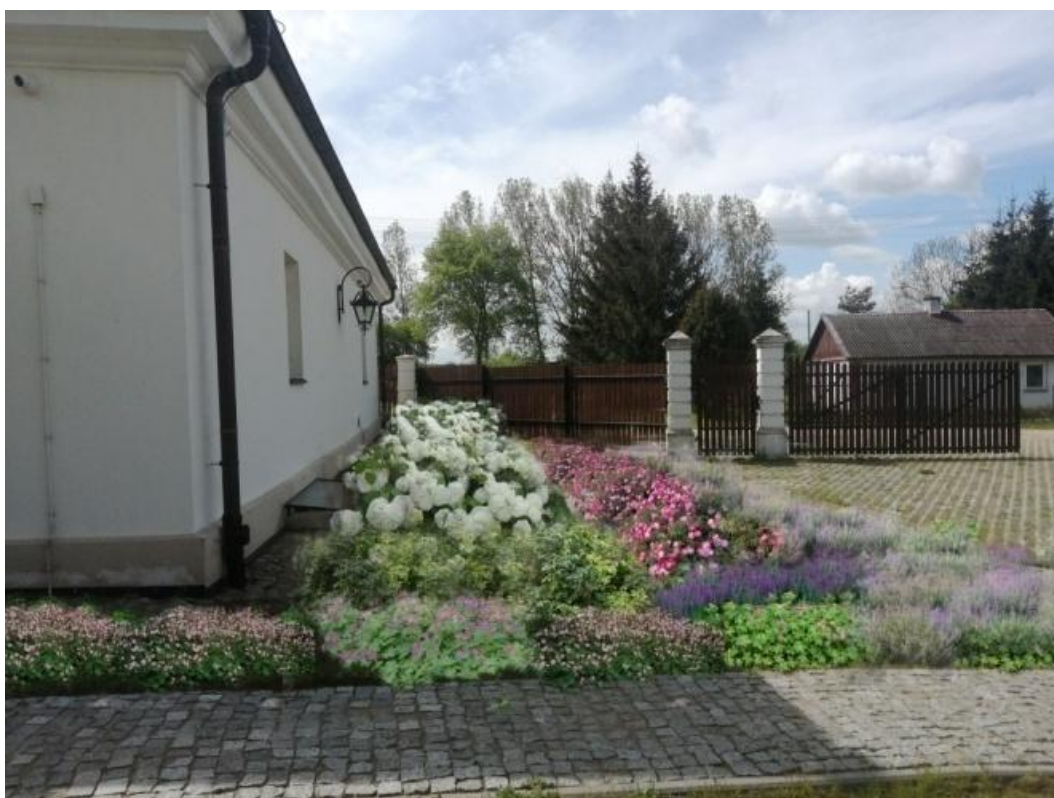
Fot.1 Wizualizacja rabaty pomiędzy parkingiem a oficyną boczną.

Całość założenia zostanie uzupełniona przez ustawione ławki oraz kosze na śmieci, które pozwolą na wygodne użytkowanie terenu. Projekt zapewnia możliwość korzystania z przestrzeni swobodnie osobom niepełnosprawnym przez brak barier terenowych.