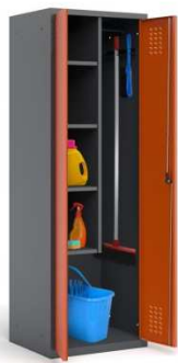
29 niski zlew gospodarczy Ujęto w części sanitarnej