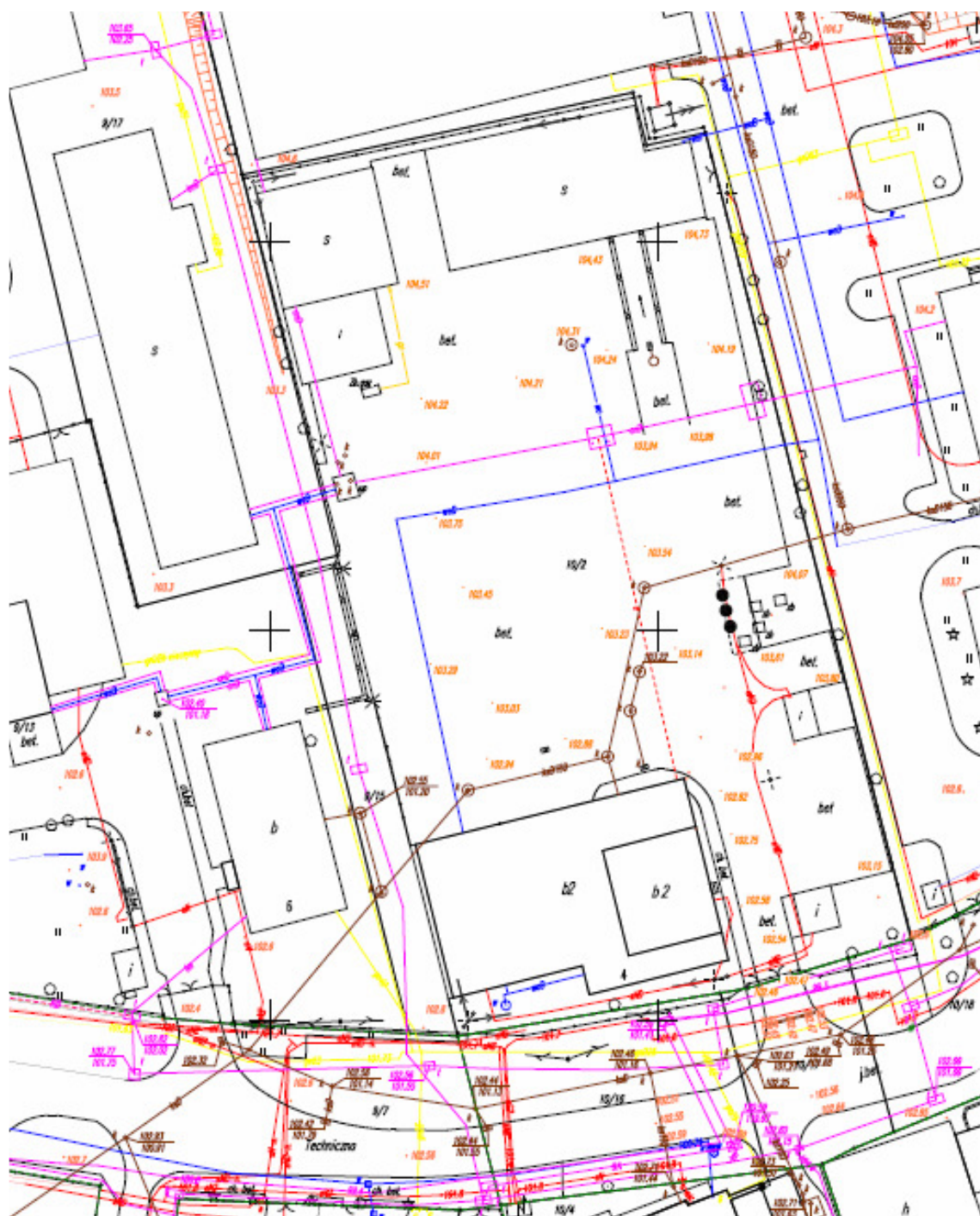
Nieruchomość przy ul. Technicznej 4

uwaga: ten dokument jest chroniony prawem autorskim prawa autorskie majątkowe: Przedsiębiorstwo Usług Komunalnych Piaseczno Sp. z o.o.