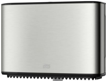
Ilustracja 26: dozownik do papieru toaletowego, zdjęcie ma jedynie charakter poglądowy.

Wybrane produkty należy przedstawić do akceptacji Inwestorowi oraz autorowi niniejszego opracowania.