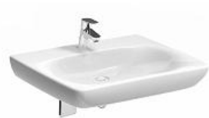
Ilustracja 6: umywalka, zdjęcie ma jedynie charakter poglądowy,