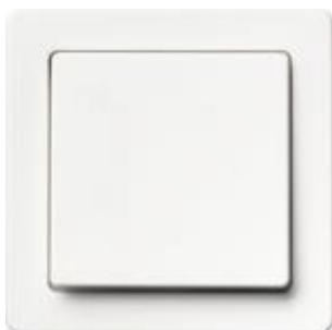
Ilustracja 5: przykładowy włącznik, zdjęcie ma jedynie charakter poglądowy,

Wszelkie detale montażowe należy omówić, przed wykonywaniem prac, z autorem niniejszego opracowania.