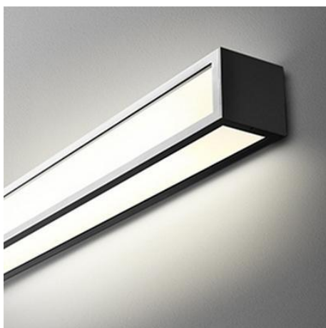
Ilustracja 14: kinkiet nad lustro, zdjęcie ma jedynie charakter poglądowy,

Wybrane produkty należy przedstawić do akceptacji Inwestorowi oraz autorowi niniejszego opracowania.