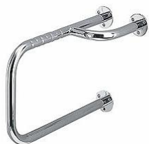
Ilustracja 8: poręcz stała obok umywalki, zdjęcie ma jedynie charakter poglądowy,

Wybrane produkty należy przedstawić do akceptacji Inwestorowi oraz autorowi niniejszego opracowania.