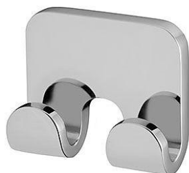
Ilustracja 28: wieszak podwójny, zdjęcie ma jedynie charakter poglądowy.

Wybrane produkty należy przedstawić do akceptacji Inwestorowi oraz autorowi niniejszego opracowania.