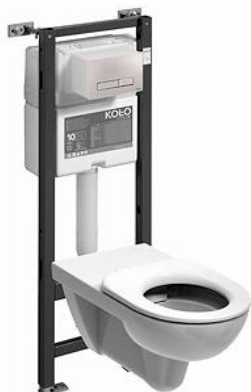
Ilustracja 9: zestaw wc, zdjęcie ma jedynie charakter poglądowy,

Wybrane produkty należy przedstawić do akceptacji Inwestorowi oraz autorowi niniejszego opracowania.