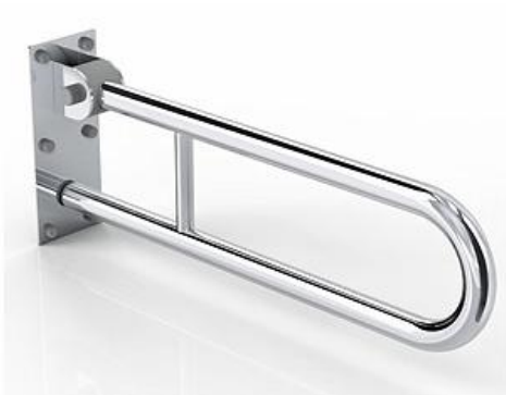
Ilustracja 11: poręcz uchylna do WC, zdjęcie ma jedynie charakter poglądowy,