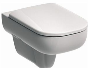
Ilustracja 19: miska ustępowa, zdjęcie ma jedynie charakter poglądowy

Podwieszana miska ustępowa ceramiczna lejowa w kolorze białym, w komplecie deska wolnoopadająca. Całość pokryta powłoką ułatwiającą czyszczenie. Długość miski: 54cm. Wybrane produkty należy przedstawić do akceptacji Inwestorowi oraz autorowi niniejszego opracowania.