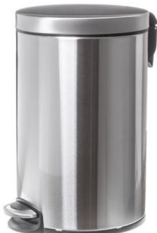
Ilustracja 27: kosz na śmieci, zdjęcie ma jedynie charakter poglądowy.

chroniąca przed wydostawaniem się nieprzyjemnego zapachu. Wykonany ze stali nierdzewnej odpornej na korozję. Wybrane produkty należy przedstawić do akceptacji Inwestorowi oraz autorowi niniejszego opracowania.