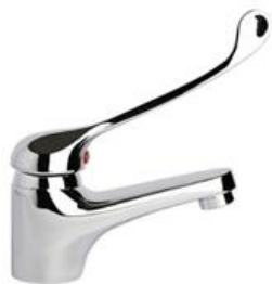
Ilustracja 7: bateria umywalkowa, zdjęcie ma jedynie charakter poglądowy,

Wybrane produkty należy przedstawić do akceptacji Inwestorowi oraz autorowi niniejszego opracowania.