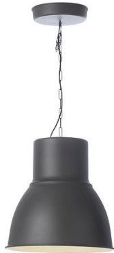
Ilustracja 2: oprawa wisząca, zdjęcie ma jedynie charakter poglądowy.