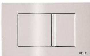
Ilustracja 10: przycisk spłukujący, zdjęcie ma jedynie charakter poglądowy,

Wybrane produkty należy przedstawić do akceptacji Inwestorowi oraz autorowi niniejszego opracowania.