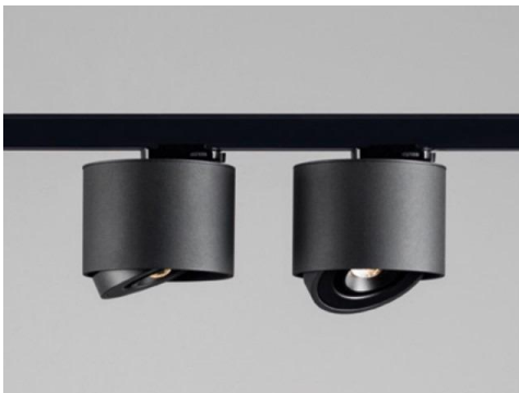
Ilustracja 3: oprawa nastropowa - szynoprzewody, zdjęcie ma jedynie charakter poglądowy.

Wybrane produkty należy przedstawić do akceptacji Inwestorowi oraz autorowi niniejszego opracowania.