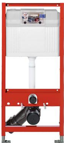
Ilustracja 17: stelaż podtynkowy, zdjęcie ma jedynie charakter poglądowy