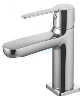
Ilustracja 16: bateria umywalkowa sztorcowa, zdjęcie ma jedynie charakter poglądowy

Wybrane produkty należy przedstawić do akceptacji Inwestorowi oraz autorowi niniejszego opracowania.