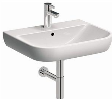
Ilustracja 15: umywalka, zdjęcie ma jedynie charakter poglądowy,