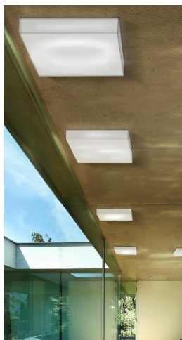
Ilustracja 13: oprawa sufitowa, zdjęcie ma jedynie charakter poglądowy,