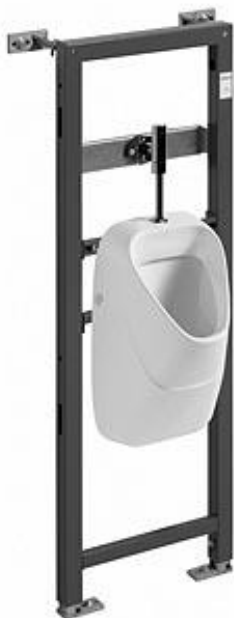
Ilustracja 20: pisuar ze stelażem, zdjęcie ma jedynie charakter poglądowy

Zestaw: stelaż do pisuaru oraz pisuar z dopływem z tyłu. Pisuar w kolorze białym ze zintegrowanym sitkiem ceramicznym. Komplet powinien zawierać zestaw montażowy, syfon oraz automatyczny radarowy zawór spustowy lub termiczny system splukujący. Wybrane produkty należy przedstawić do akceptacji Inwestorowi oraz autorowi niniejszego opracowania.