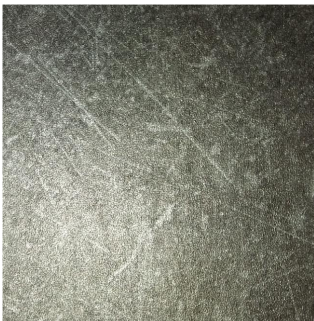
Ilustracja 1: wykładzina PVC, zdjęcie ma jedynie charakter poglądowy,

Przed zamówieniem wykładziny jej próbkę należy przedstawić do akceptacji Inwestorowi oraz autorowi niniejszego opracowania.