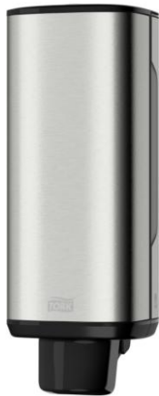
Ilustracja 24: dozownik do mydła, zdjęcie ma jedynie charakter poglądowy,

Wybrane produkty należy przedstawić do akceptacji Inwestorowi oraz autorowi niniejszego opracowania.