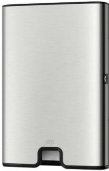
Ilustracja 25: dozownik do ręczników papierowych, zdjęcie ma jedynie charakter poglądowy.

Wybrane produkty należy przedstawić do akceptacji Inwestorowi oraz autorowi niniejszego opracowania.